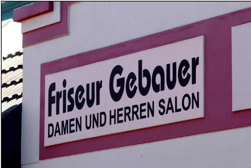
Middedorp, Swakopmund, Namibië