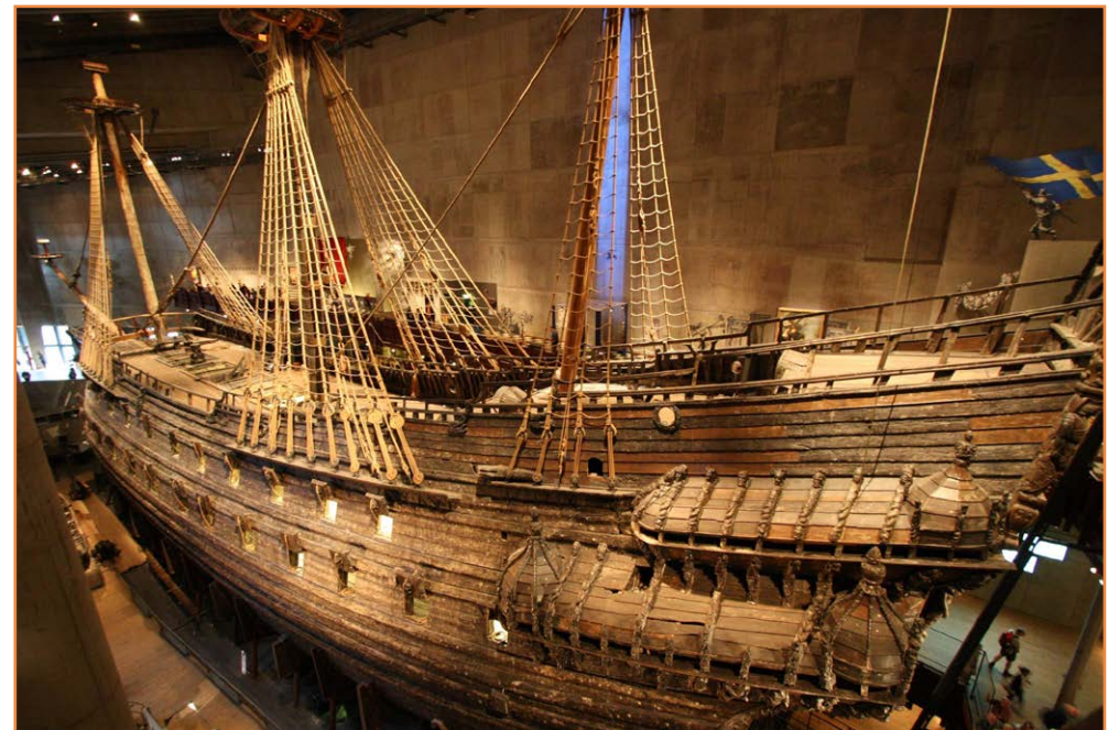
Die gerestoureerde skip Vasa in die Vasa-museum

Nog een van die baie toeriste-aantreklikhede wat beslis besoek moet word, is die Vasa-museum (Sweeds: Vasamuseet ). Die skip Vasa was 'n Sweedse oorlogskip wat tussen 1626 en 1628 gebou is. Die skip het op 10 Augustus 1628 op haar nooiensvaart uit die hawe van Stockholm vertrek. Net buite die hawe, na slegs 1,3 km se vaart, het die skip skielik gesink!