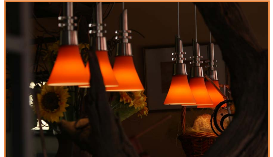
Swakopmund, Namibië; foto oordag geneem om 10:45

Stel die sluiterspoed vir 'n begin volgens die liniaal, en onderbelig dan stap-vir-stap om luim te skep.