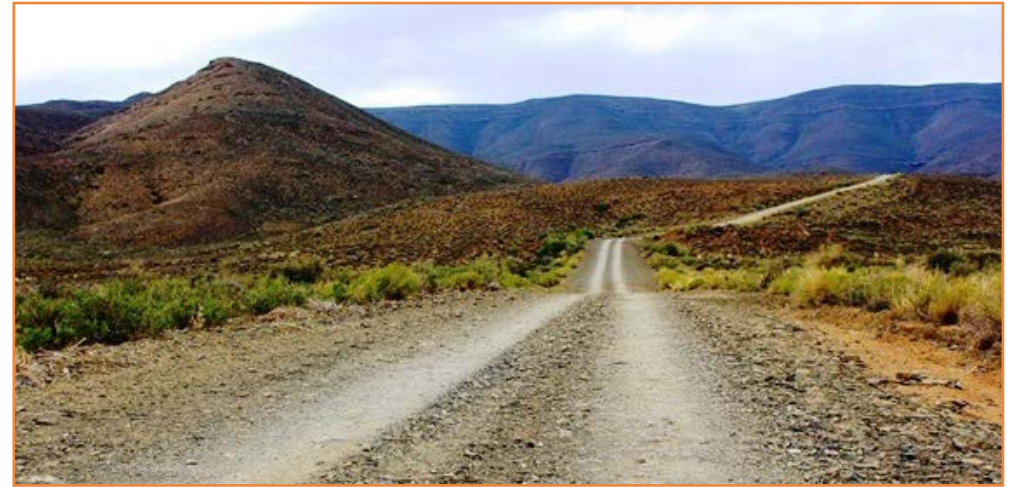
Begin van Oubergpas

Gelukkig is daar ander passe, grondpadpasse, waar daar meer stopplekke is en waar jy as fotograaf, as die tyd aan jou kant is, na hartelus foto's kan neem en jou drome kan uitleef.