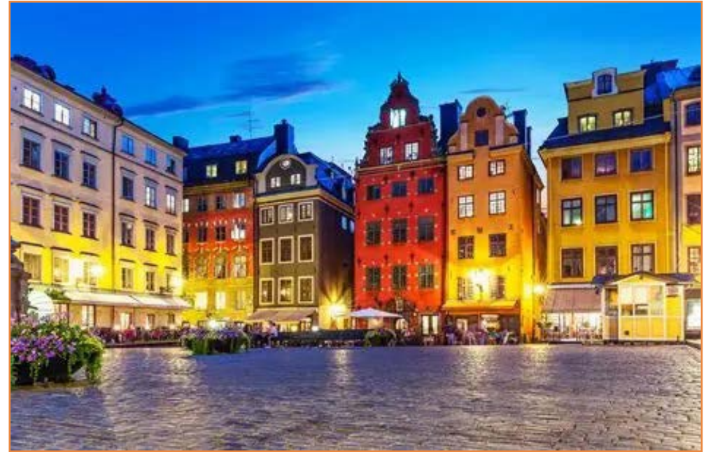
Gamla Stan, Stockholm

onderdele van die skip, soos maste, houtwerk, boegbeelde en ander skeepsversierings.