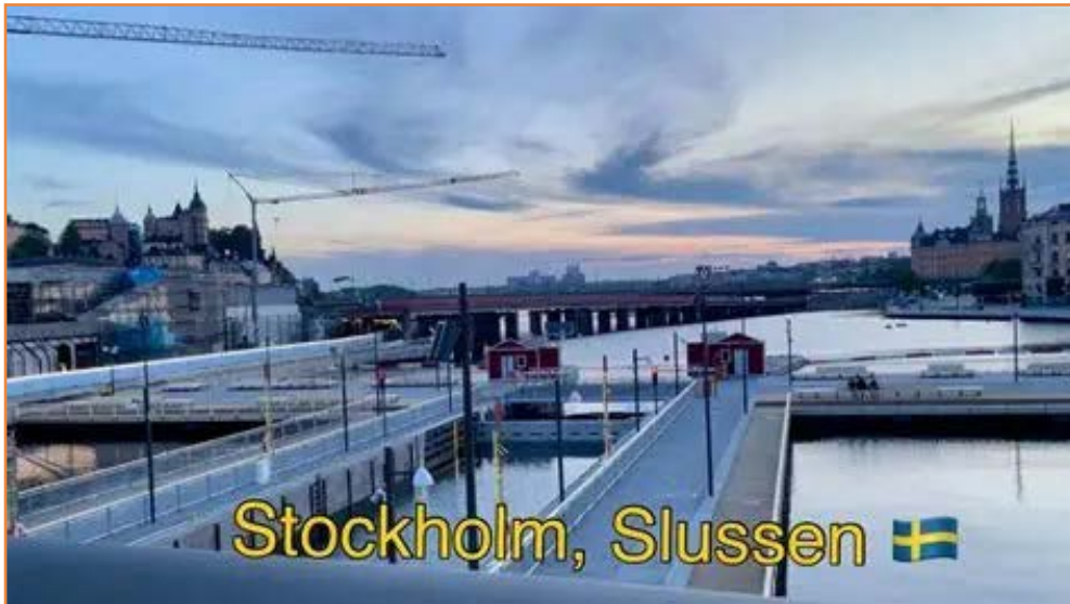
Waterwerke, Stockholm, Slussen

Vir reisigers, in die besonder fotografeer, is dit beslis die moeite werd om hierdie museum te besoek. Met my eie besoek aan die museum twee dekades gelede, was my ervaring wel dat jy nie ver genoeg kan kom om die skip as geheel te fotografeer nie. Jy moet dan maar tevrede wees met die fotografering van