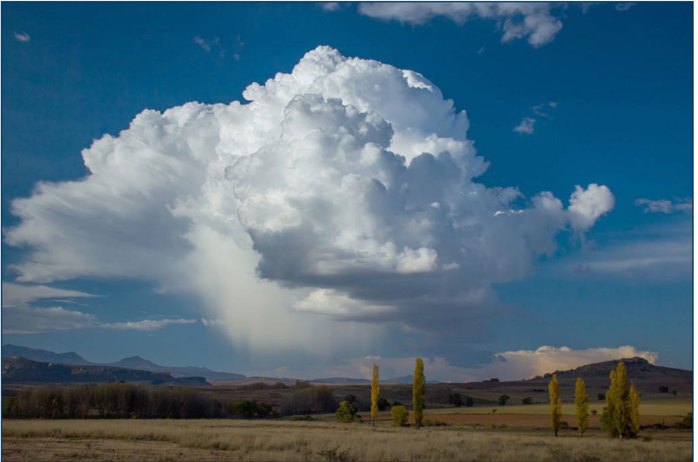
"Reënbelofte" ... Johann Nel Lensopening f4; Sluiterspoed 1/1000; ISO 200

Gedurende hierdie maande waarin Towerlantern Fotografie tien jaar oud word (1 Desember om presies te wees) wil ons hulde bring aan en ons dank betuig teenoor al ons fotografievriende. Teen 'n gemiddeld van ongeveer 10 persone per klasgroep en 40 kursusse (net die eerstevlakkursusse getel) staan dit op 400 kursusgangers. Dis 'n aansienlike hoeveelheid mense!