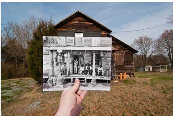
Country Store on Dirt Road, Gordonton, North Carolina

Die foto hierby toon die idee, maar kyk self na sy ander interessante foto's by die onderstaande adres. Probeer ook soortgelyke tonele skep en stuur dit in.