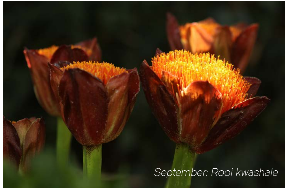
September: Rooi kwashale