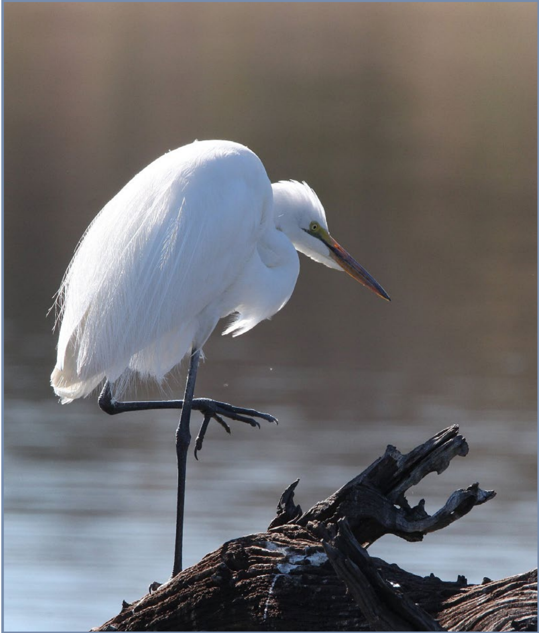
"Vrøegoggend-getittewyt" ... Fanie Coetsee Lensopening f13; Sluiterspoed 1/250 sekonde; Fokale lengte 560 mm

In Nederland word daar na April (ongeveer ons ekwivalent van Oktober) verwys as "April, April, hy doen wat hy wil". En dit kon ons met vanjaar se Oktober ook beleef. Oktober is algemeen die hælmaand en hierdie jaar ook die tornadomaand in Suid-Afrika; onder andere naby Bethulie waar ek vandaan kom. Ons sou kon sê die weer was bra ongestadig.