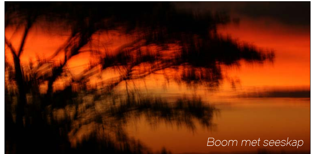
Boom met seeskap