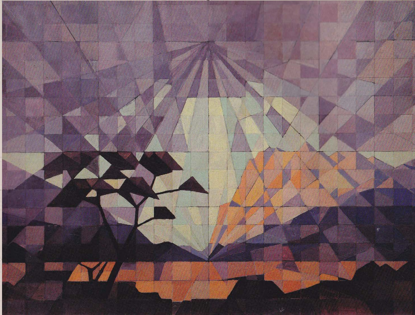
DeKat, Maart/April 2017, bladsy 50

Nog 'n skilder wie se werke teen besonder hoë bedraë oorsee verkoop word, is die Suid-Afrikaanse skilder JH Pierneef (1886-1957). Die skildery hierby, getiteld, Komposisie, Suidwes-Afrika , is maar een van baie van sy uitstaande werke. Dit toon ook een van verskeie style waarvoor hy bekend is, naamlik kubisme. Van hierdie werk word gesê ( Wikipedia, Jakobus Hendrik Pierneef ): "Pierneef se abstrakte werke het hewige kritiek uitgelok en hy het uiteindelik na sy tradisionele styl teruggekeer." Wat 'n jammerte.