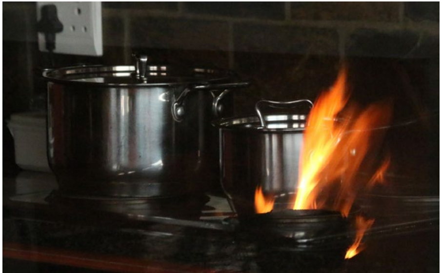
Die stoof brand!

Ook was die aanvanklike idee nie om jou, die kyker, met enige van hierdie foto's te kul nie.