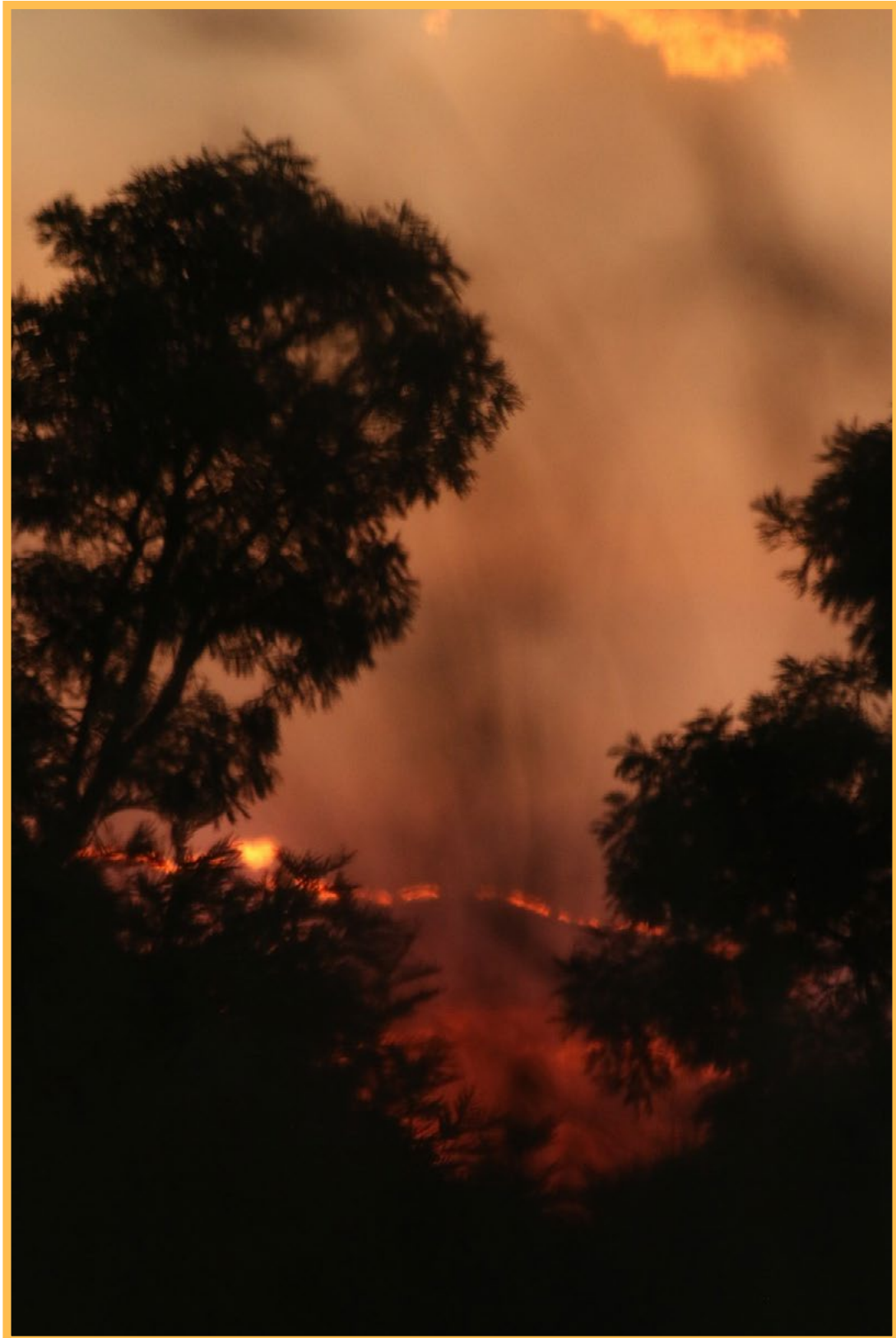
Die veld brand!