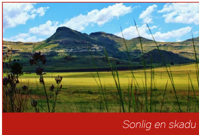
Sonlig en skadu

Opmerkings in verband met Sonlig en skadu :