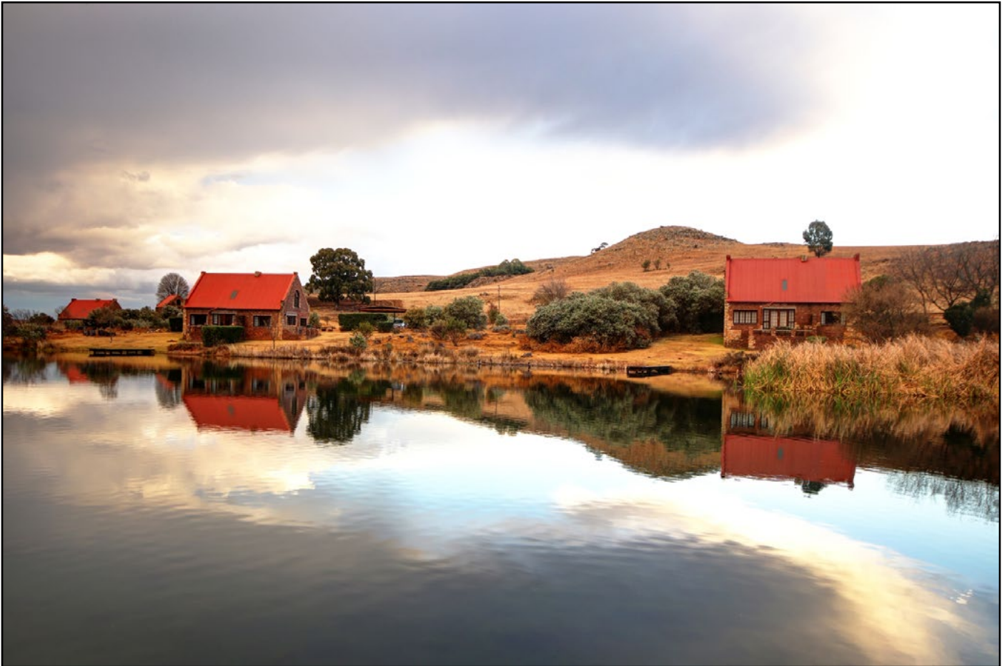
"Millstream Farm, Dullstroom"

Lensopening: f5.6; Sluiterspoed: 1/15-1/60 sekonde; Fokale lengte: 20 mm